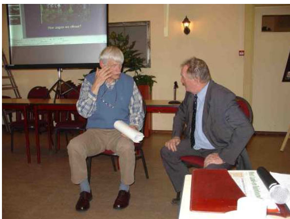
De twee Dirken met elkaar in discussie

tafel te gaan zitten zoals nu in Plan Achterberg gebeurt.