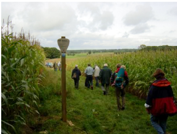
Impressie van het klompenpad

Aan dit nieuwe klompenpad hebben gelukkig meerdere Achterbergse grondeigenaren hun medewerking verleend, maar een gedeelte van de route loopt nu nog langs het onlangs geopende fietspad aan de Grift.