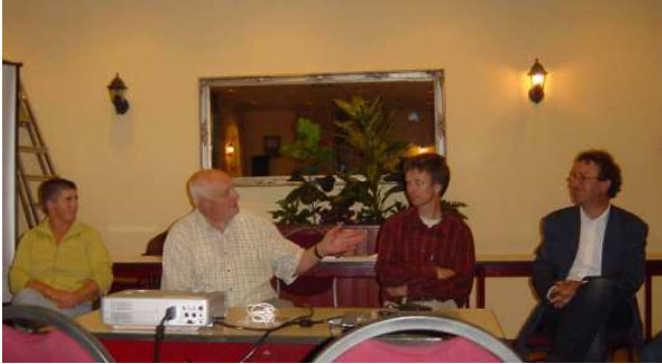
Het forum in discussie...