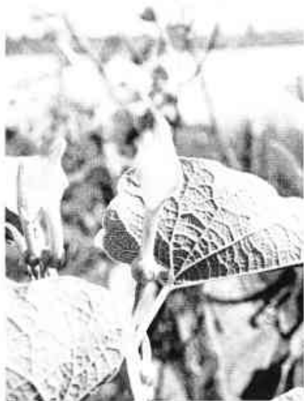
Pijpbloem ( Aristolochia clematitidis ) groeit aan weerszijden van het fietspad.

Maar ook de hellingen van de afgraving en de zandruggen die niet of niet volledig zijn afgegraven zijn floristisch van groot belang. Onder meer vanwege het voorkomen van de zeldzame vetplant Tripmadam , die in Nederland uiterst zeldzaam is maar hier op de hellingen met vele duizenden exemplaren voorkomt. Ook zeldzame soorten als Dwergviltkruid en Duits viltkruid komen hier voor.