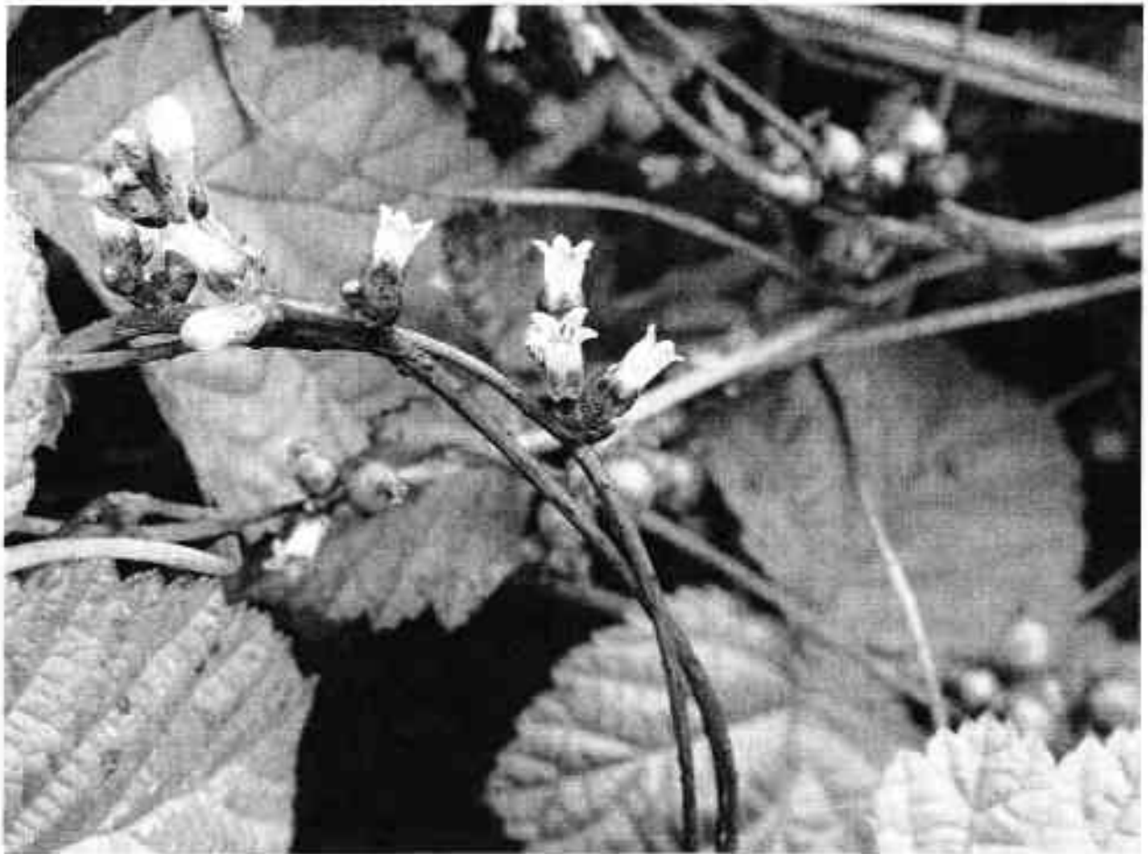
Hopwarkruid woekerend op braam.

De plas zelf valt op door het on-Nederlandse heldere water, met daarin velden van Kranswier en Doorgegroeid fonteinkruid . De plas wordt niet direct bedreigd door de plannen voor woningbouw, maar -afhankelijk van de inrichting van het gebied- wel door menselijke verstoring. Dit kan een probleem zijn voor de Ringslang die hier voorkomt. Het is voor deze soort van belang dat de plas niet aan alle kanten wordt ontsloten en dat er genoeg rustige plekjes overblijven waar de slangen kunnen zonnebaden en liefst ook eieren leggen.