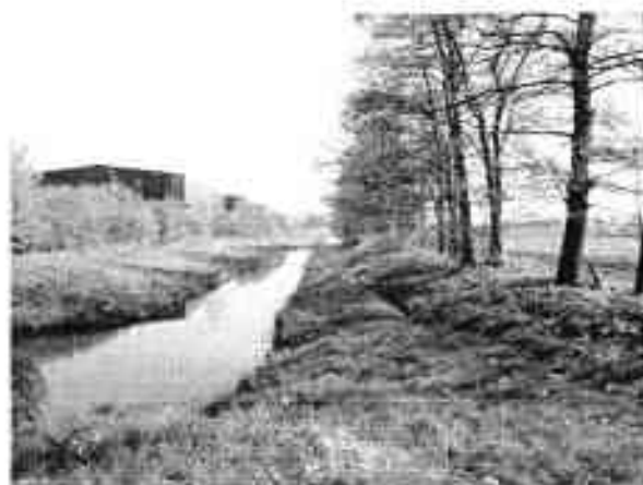
Figuur 3: Sloot aan de zuidzijde van het industrieterrein Veenendaal. Met een iets bredere houtwal vormt dit een perfecte verbindingzone voor zowel water- als landdieren.