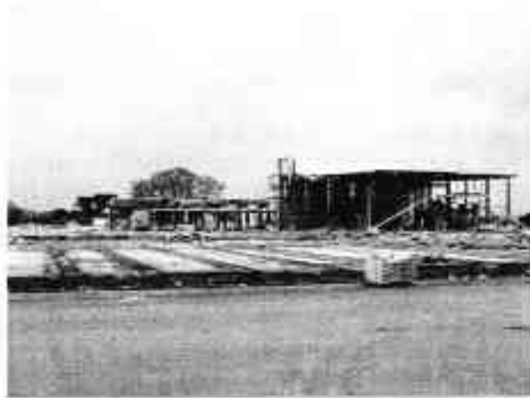
Sloop van de voormalige zandsteenfabriek Vogelenzang, april 2005. De gemeente wil op deze plek graag woningbouw.

Aan het einde van de zomer komen in de ruige begroeiing langs de Rijn ook een tweetal warkruiden voor, parasitaire planten alleen bestaand uit stengels met zuignapjes en kluwens van kleine, witachtige bloemetjes. Het zijn het Hopwarkruid , dat groeit op braam, en het Groot warkruid , dat hier -zeer verwarrend- groeit op Hop. Het is van groot belang dat deze zuidelijke strook bij de inrichting van het terrein gespaard blijft en dat er ook aan de noordzijde van het fietspad voldoende ruimte blijft voor spontane plantengroei.