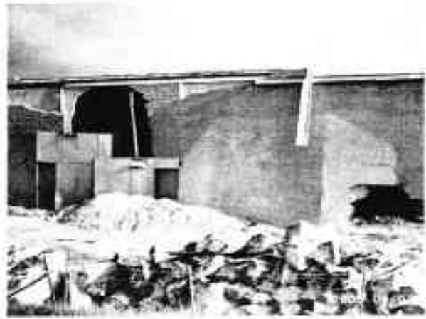
Houtversnipperingsbedrijf Van den Broek

In mei verleende de gemeente Buren een milieuvergunning aan het bedrijf K3 voor de inrichting van een op- en overslagbedrijf voor zand, grind, klei en bulkgoederen ten behoeve van de weg- en waterbouw. De voorgenomen op- en overslag is gepland aan de plas waar vroeger de jachthaven lag tussen het houtversnipperingsbedrijf Van den Broek en het mengveevoederbedrijf Coohoud B.V. De WMR hoorde pas in april van het voornemen van Buren om de vergunning te verlenen via een mededeling in het weekblad "De Stad Buren". Op dat moment was de besluitvorming al te ver gevorderd om nog bezwaar te kunnen maken. Beroep bij de Raad van State zou weinig kans maken omdat de WMR bij de ontwerp vergunning niet had gereageerd. Gelukkig is het zo dat met de verleende milieuvergunning K3 nog niet kan starten met het op- en overslagbedrijf. De geplande activiteit voldoet namelijk niet aan het bestemmingsplan "Uiterwaarden" van Buren.