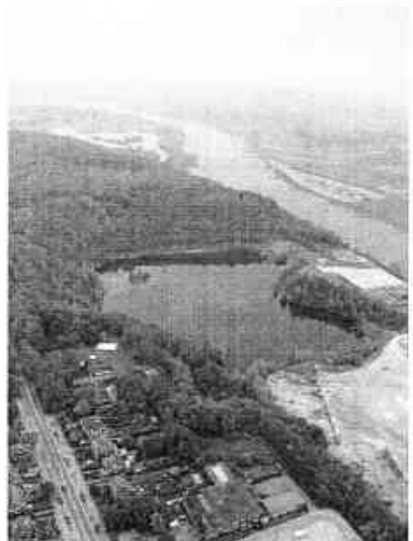
Vogelenzang vanuit de lucht met rechtsonder een deel van het voormalige fabrieksterrein.