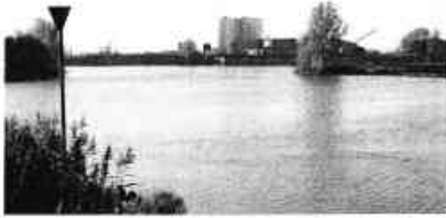
Veevoederfabriek Coohoud B.V.

stoffen die worden gebruikt in het productieproces. Er is geen relatie te leggen tussen de stankhinder en bepaalde soorten veevoeder die worden geproduceerd, zoals aanvankelijk werd gedacht. Er is uiteraard wel een relatie met de windrichting en de windsnelheid. Rhenen heeft vooral last bij wind