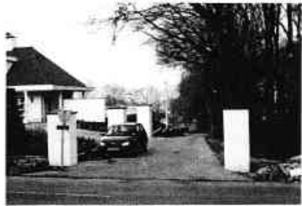
Bergweg 3: Gebrek aan handhaving vergroot het risico op verstening van de Bergweg; juist de rafelige overgang van 'rood' naar 'groen' is beeldbepalend voor deze kant van Rhenen.

In het tweede gesprek met B&W in oktober stelde de WMR de relatie met de gemeente aan de orde. Aanleiding daarvoor was een aantal actuele situaties waarin de gemeente handhavend behoort op te treden en daarop door de WMR herhaaldelijk was geattendeerd. In die gevallen werd niet gehandhaafd maar ontstond een gedoogsituatie die uiteindelijk als definitief lijkt te worden aanvaard. Dit is frustrerend want het geeft het slechte voorbeeld aan anderen en het ondermijnt de geloofwaardigheid van de gemeente. Het gaat om het tuincentrum De Wildernis, de Manege Miltenburg, het bedrijventerrein Achterberg en de woning Bergweg 3. De WMR constateert dat het cruciale moment bij