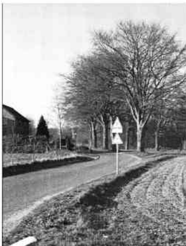
Figuur 2 De Boslandweg-Oost is nu nog een fraai overgangsgebied tussen de bebouwde kern en de Laarsenberg en voor bosdieren een belangrijke 'stepping stone' in de verbinding tussen Laarsenberg en Utrechtse heuvelrug.

Daarom zijn op grond van ons bezwaar geen veranderingen aangebracht in het ontwerp bestemmingsplan.