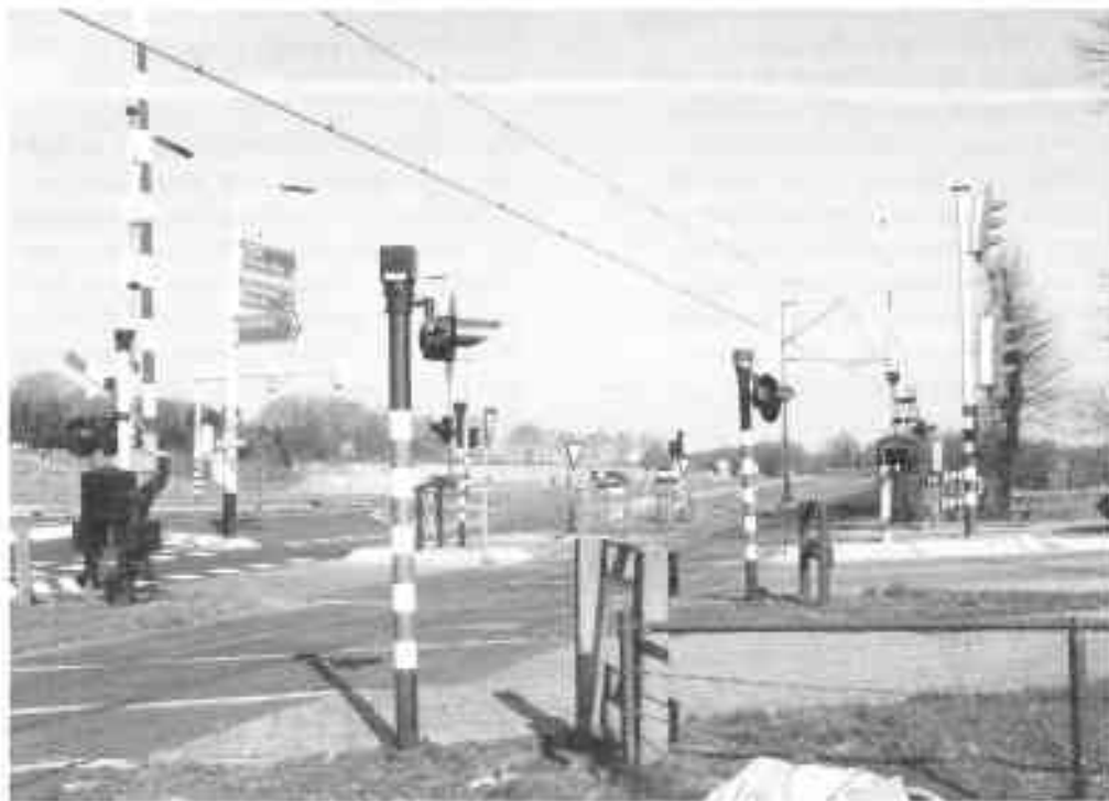
Figuur 1: De kruising tussen de Lijnweg en de Achterbergse Straatweg vormt samen met het aangrenzende 'ambachtelijke' industrieterrein een knelpunt voor de ecologische verbinding tussen Laarsenberg en Utrechtse Heuvelrug

Het drukke kruispunt tussen de Lijnweg en de Achterbergse Straatweg (figuur 1) en het bedrijventerrein tussen de Achterbergse Straatweg en de Boslandweg vormen de grootste knelpunten. Doordat het bedrijventerrein direct grenst aan de kruising is hier sprake van een aaneengesloten, voor dieren vrijwel onneembare barrière.