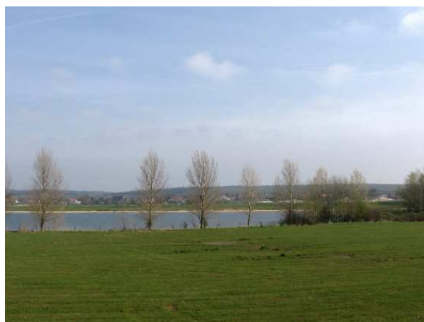
Uitzicht op de bergingslocatie

In de uitspraak gaat het om complexe juridische argumentaties met verwijzingen naar de omzetting van Europese regelgeving in nationale wetgeving en interpretatie van Nederlandse wet- en regelgeving. Winst is dat de Wm vergunning voor bepaalde tijd moet worden afgegeven in tegenstelling tot het standpunt van Gelderland dat de Wm een tijdelijke vergunning niet toestaat en dus dat GS gehouden was een vergunning voor onbepaalde tijd af te geven. Wij hadden in onze zienswijze op de ontwerp beschikking ook aangedrongen op het afgeven van een vergunning voor een bepaalde periode.