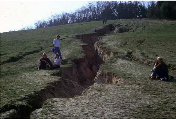
Nog meer erosie: erosiegeul

De Rugstreeppadden lijken net als de variatie aan libellensoorten inderdaad baat te hebben bij de aanleg van de nieuwe poelen, maar er is wel bezorgdheid dat de grote aantallen bezoekers van de motorcrosses de veel padjes kunnen vertrappen. Anderzijds hebben de moerasvogels nu minder dekking en deze zijn daardoor in aantal en variatie sterk verminderd.