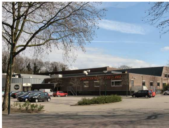
Zwembad 't Gastland

't Gastland toont zich sterk geïnteresseerd. Nadat de investering zou zijn terugverdiend, kan jaarlijks flink bespaard worden op de aardgaskosten. Een positieve beslissing kan echter pas worden gemaakt als de onderhandeling over voortzetting van de exploitatie-overeenkomst tussen de gemeente en 't Gastland (die afloopt aan het einde van 2009) en de grootte van de gemeentelijke bijdrage goed uitpakt. Die onderhandeling is kort geleden gestart.