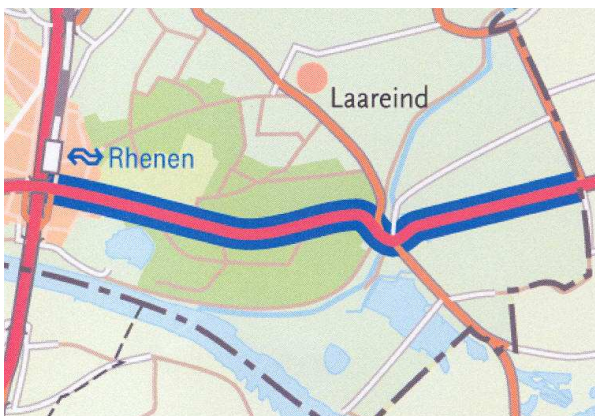
Locatie van de aanpassing

De provincie Utrecht heeft het voornemen de fietsverbinding langs de N225 vanaf de kruising met de N233 over de Grebbeberg tot aan de provinciegrens te verbeteren. Volgens de provincie is die verbetering nodig vanwege verbetering van de subjectieve veiligheid en het fietscomfort. Het voornemen houdt in dat de weg wordt verbreed van 9,5 meter naar 11 meter. In het plan zijn dubbelzijdige fietspaden met ieder één rijrichting gepland die iets hoger liggen dan de weg en daarvan gescheiden worden door opstaande randen. Voor de insnijding in de Grebbeberg betekent de verbreding dat afgraving en verplaatsing van het noordelijke talud met 1,5 meter dient plaats te vinden.