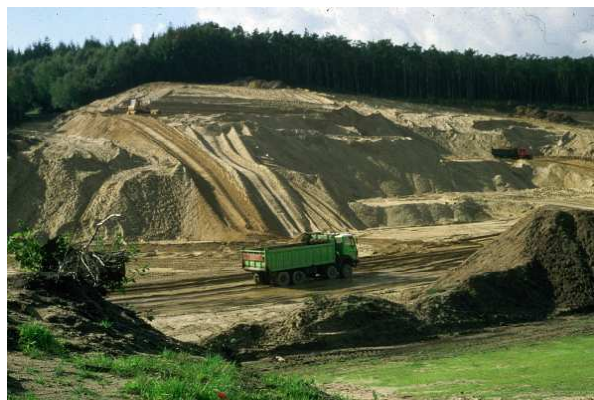
Aanleg hellingbanen: erosie

Helaas kan niet elk advies opgevolgd worden. Bijvoorbeeld t.b.v. de vlinders en libellen heeft men kleinschalig beheer geadviseerd, respectievelijk de bosranden structuurrijker te maken en de verlande oevers gedeeltelijk weer open te maken, maar dat zijn vrij subtiele ingrepen en dus misschien moeilijker uit te voeren.