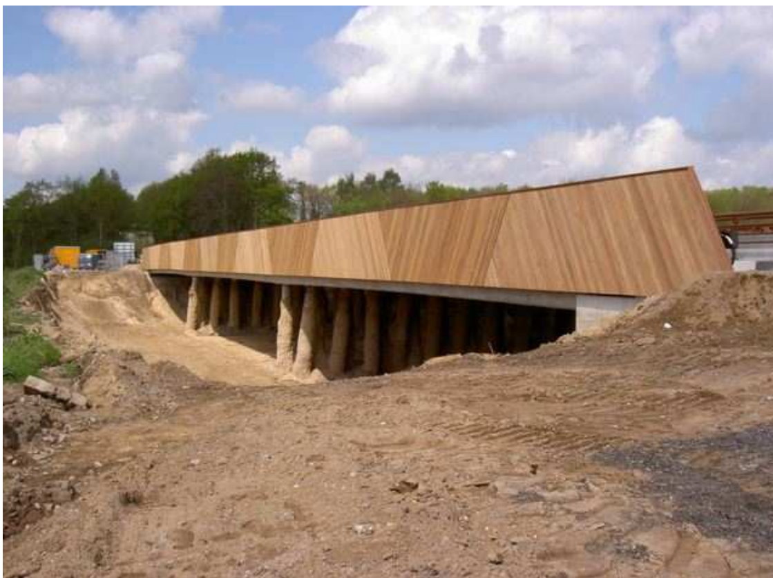
Ecopassage Elst: Foto van de onderdoorgang voor wild (bijna klaar)