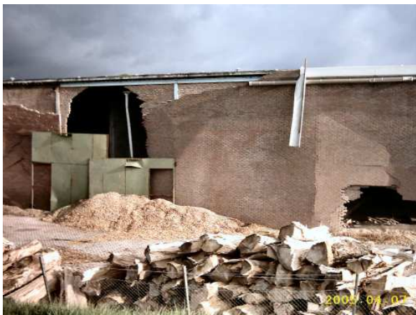
De bouwval die gesloopt gaat worden

Er is een herziening van het bestemmingsplan in voorbereiding met de opstelling van een ontwerp. Dat is volgens informatie van de gemeente Buren minder ambitieus dan het bedrijf zou willen. Het ligt in de bedoeling om herbouw binnen het volume van de bouwval van de voormalige steenfabriek toe te staan. Het bedrijf wil door middel van een loswal aan de plas gebruik maken van aan- en afvoer over de rivier. De huidige aanvoer van boomstammen en stronken en afvoer van snippers en zaagsel is geheel per vrachtauto over de Marsdijk.