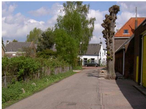
Ontsluitingsweg: geschikt voor zwaar vrachtverkeer?

Omdat alle argumenten raakvlakken hebben met andere gemeentelijke beleidsdoelen, verzoeken wij de gemeente de vergunningafgifte te heroverwegen.