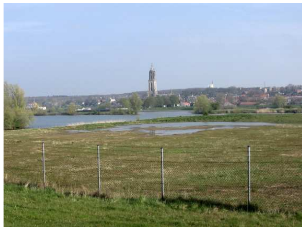
Locatie op- en overslag zand en grind

Buren heeft in april na twee jaar (!) de 5 inspraakreacties beantwoord, die waren gemaakt op het voorontwerp bestemmingsplan, waaronder die van ons. Conclusie: onze zienswijze geeft aan Buren geen aanleiding tot aanpassing van het plan. Omdat ook de andere zienswijzen geen aanleiding gaven tot een ander standpunt, is Buren van plan om in mei het ontwerp bestemmingsplan bekend te maken voor een inspraakperiode van 6 weken.