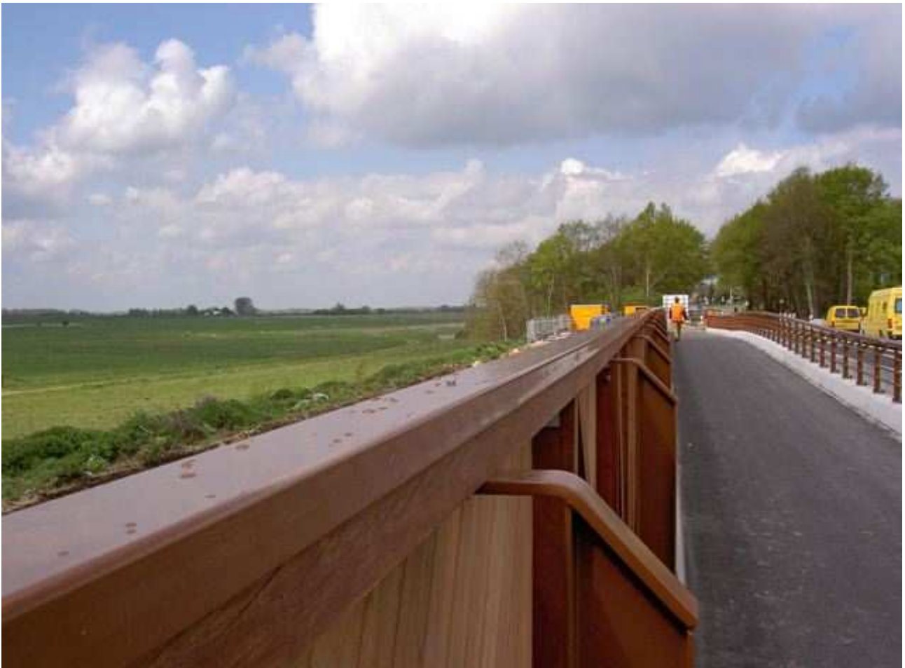
Ecopassage Elst geopend voor verkeer (28 april 2008)