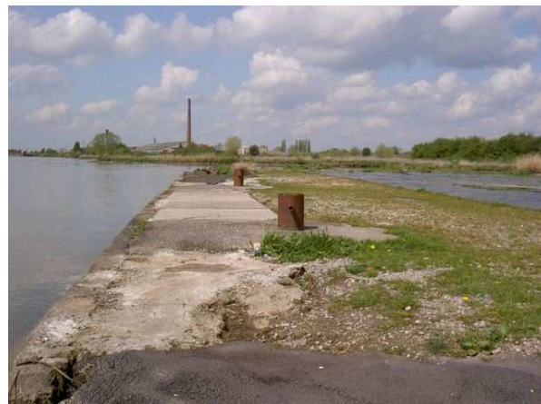
De loswal in huidige toestand

De visie op de uiterwaarden is in de afgelopen decennia sterk veranderd, te weten: "versterking van natuurwaarden". Ook de Structuurvisie in 2008 schrijft hier nadrukkelijk over: "de toekomstige ontwikkeling van de uiterwaarden moet meer richting recreatie en natuurontwikkeling gaan".