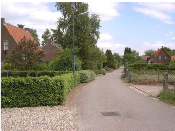
Meer inbreiden? Behoud open karakter!

Tijdens de debatavonden heeft wethouder Van Hees toegegeven dat deze stedenbouwkundige visie eenzijdig is. Bezorgde vragen naar de verkeersafwikkeling van beoogde bouwlocaties werden afgewimpeld. “Dit is bewust geen punt van afweging geweest, de inwoners mochten immers dromen”. De wethouder gaf toe dat er na een integrale afweging waarschijnlijk diverse bouwlocaties zullen afvallen. Anderzijds benadrukte hij wel de status door deze stedenbouwkundige visie alvast op te waarderen als opmaat tot de toekomstige integrale Gemeentelijke structuurvisie.