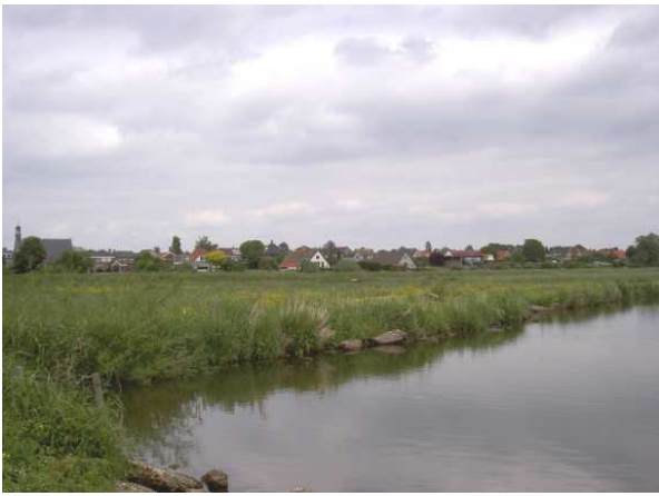
Rhenen & Elst: Bescherming uiterwaarden

Ten slotte is een belangrijk aandachtspunt in de zienswijze van de WMR de juridische status "Natura 2000" van de uiterwaarden. Hierdoor is er slechts ruimte voor extensieve recreatie, en dan nog buiten het broedseizoen. Alle droombeelden over horeca + parkeerplaatsen en passantenhavens zullen niet mogelijk zijn.