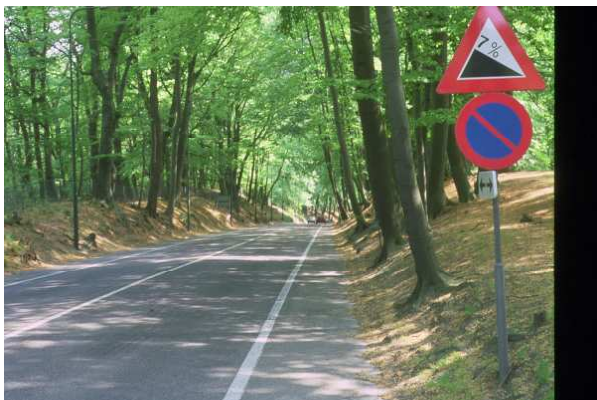
Helling van 7%

Daarentegen is de WMR van mening dat enkele verbeteringen aan de bestaande situatie mogelijk zijn die de verkeersveiligheid vergroten en